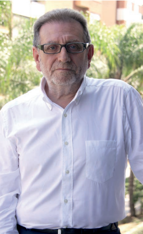
Jes3s Ros Piles ALCALDE DE TORRENT