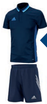
Equipación jugador de campo