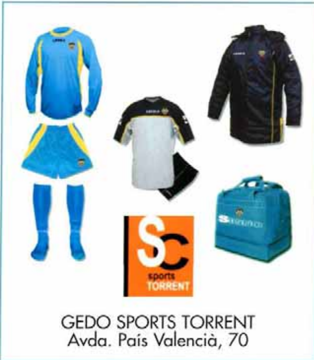
GEDO SPORTS TORRENT Avda. País Valencià, 70

En l'intent de millorar la imatge de l'Escola, de forma que estiga més d'acord amb la categoria dels nostres jugadors i tècnics i amb els excel·lents resultats que es vénen obtenint en les diferents categories, en la pròxima temporada tots els nostres esportistes portaran un nou equipatge de competició, una vestimenta de passeig per a quan faça bon temps, el xandall habitual del que ens sentim molt satisfets, per a avançat la tardor, i una peça d'abric per al període hivernal. A més, a cada jugador se li entregarà la roba d'entrenament i per descomptat, una bossa d'esport, a fi que tots vagen igualment uniformats.